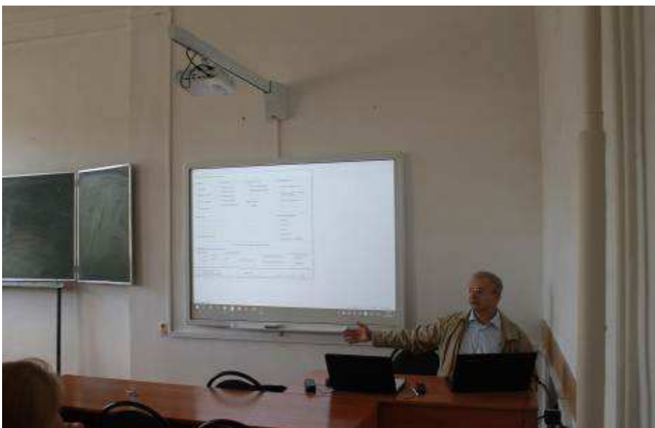
Мультимедийная аудитория для практических занятий