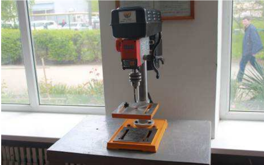
Лаборатория обработки металлов (сверлильный станок)