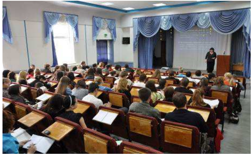
Конференц зал 2