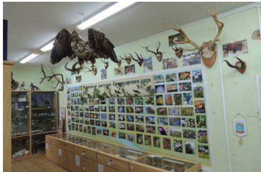
Эколого - краеведческий музей