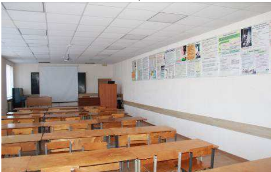
Кабинет теории и истории физической культуры