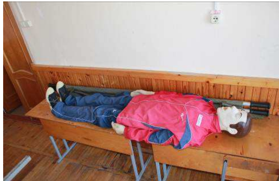
Лабораторный манекен Т12 «Максим»