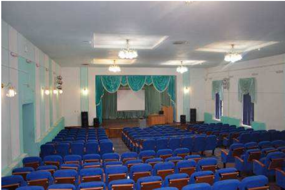
Конференц зал 1