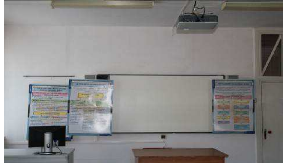
Кабинет правовых дисциплин