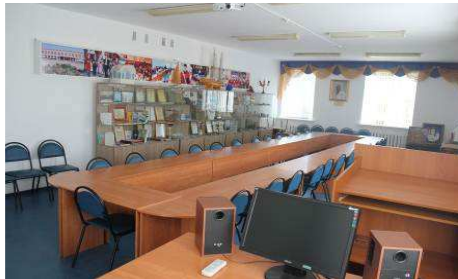
Музей истории филиала. Учебная аудитория