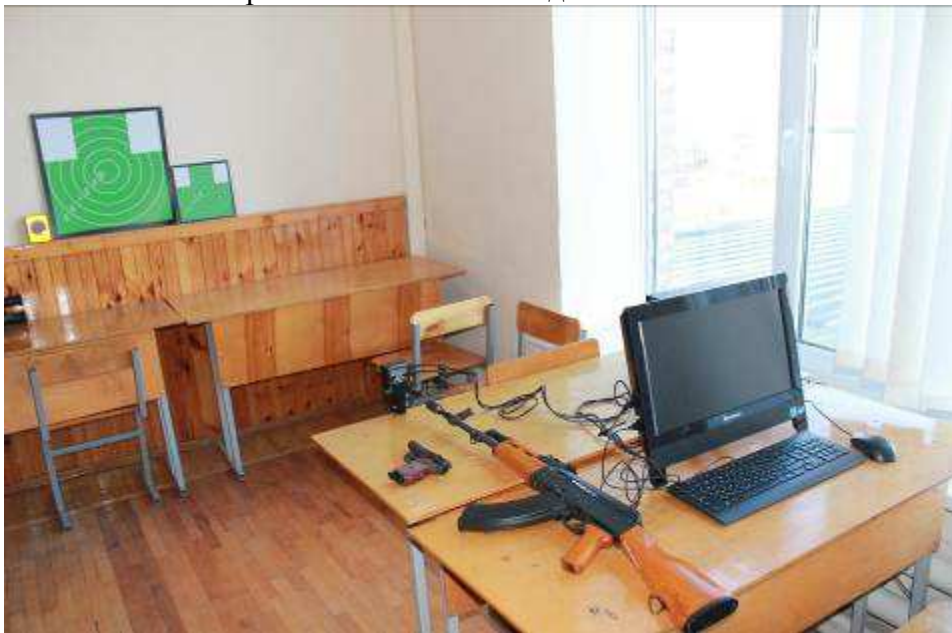
Интерактивный лазерный стрелковый тир