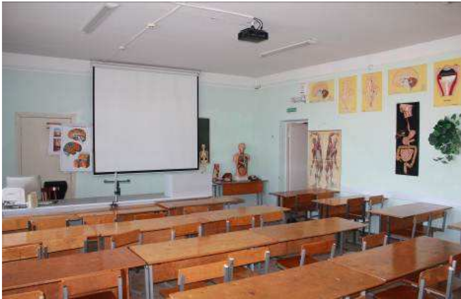
Кабинет анатомии и физиологии человека