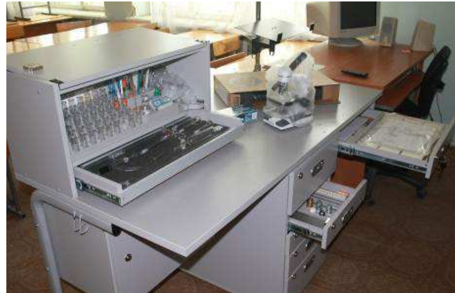
Кабинет естественнонаучных дисциплин