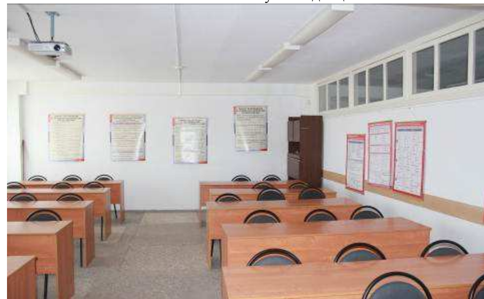
Кабинет русского языка и литературы 1