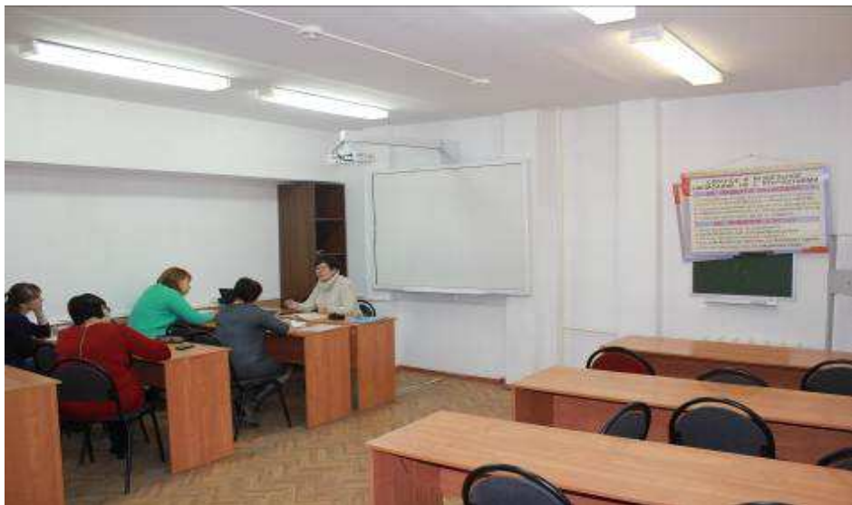
Кабинет русского языка и литературы 2