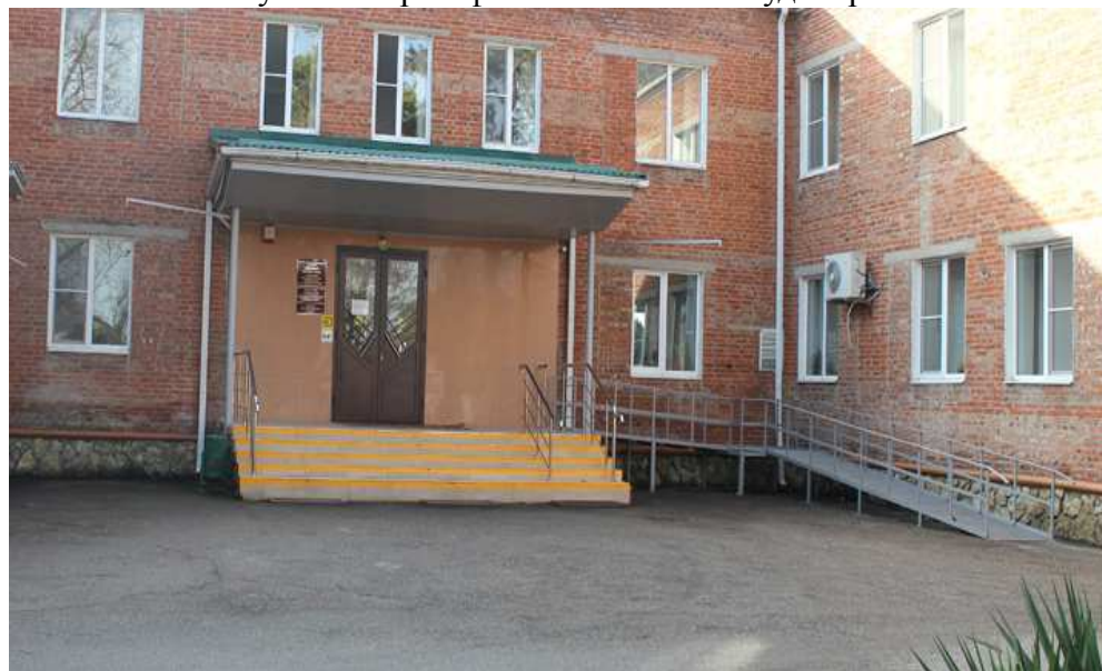
Здание учебного корпуса