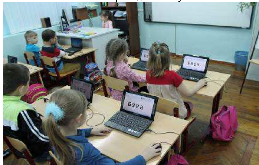
Центр развития ребенка