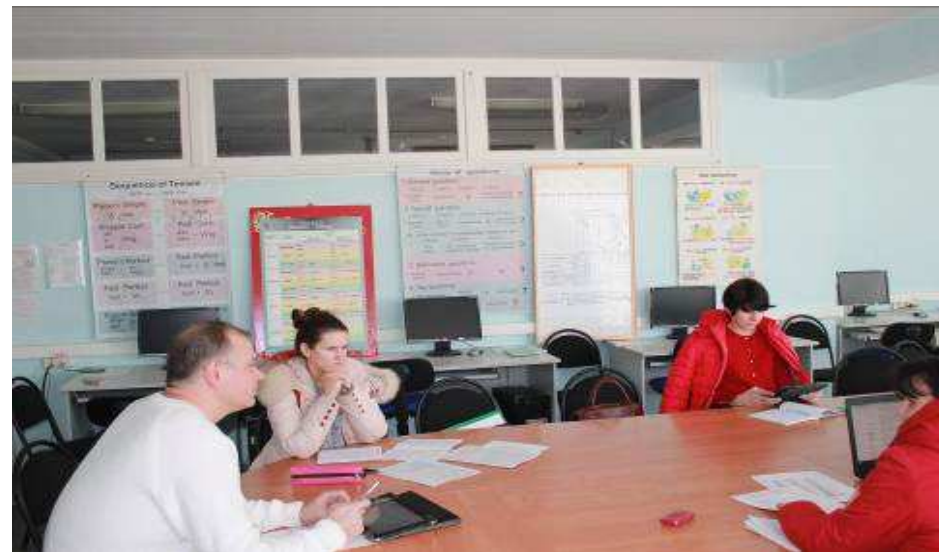
Кабинет иностранных языков