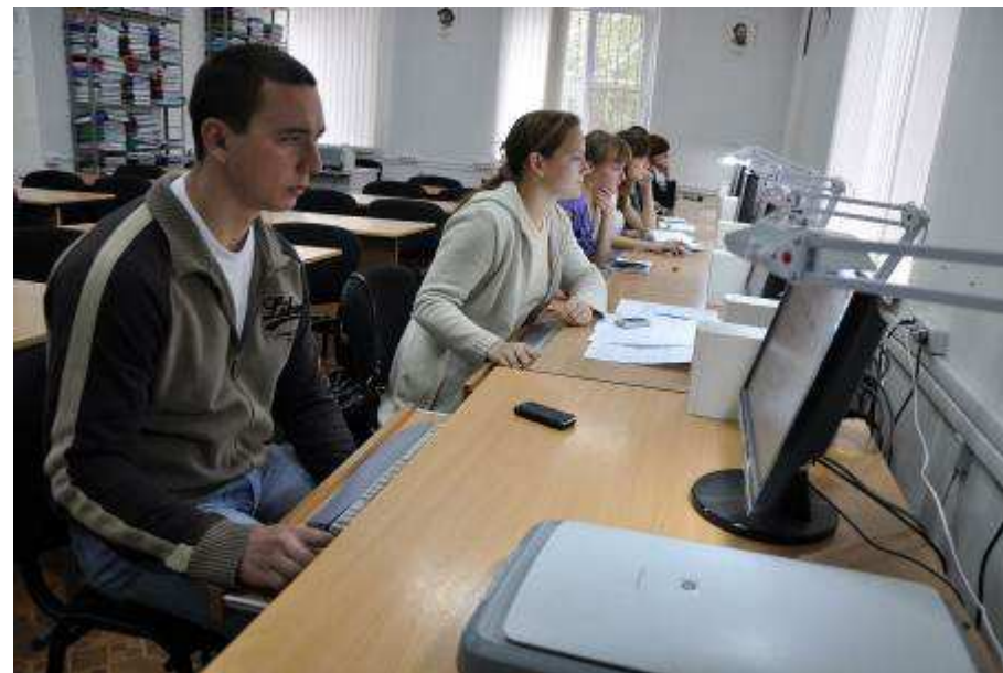
Библиотека. Читальный зал