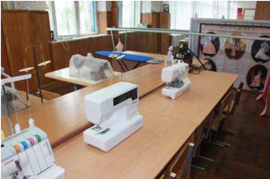
Лаборатория обработки тканей