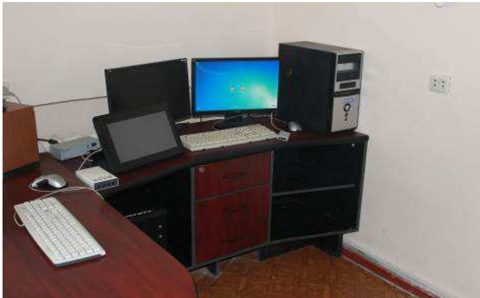
Интерактивный кабинет педагога-психолога