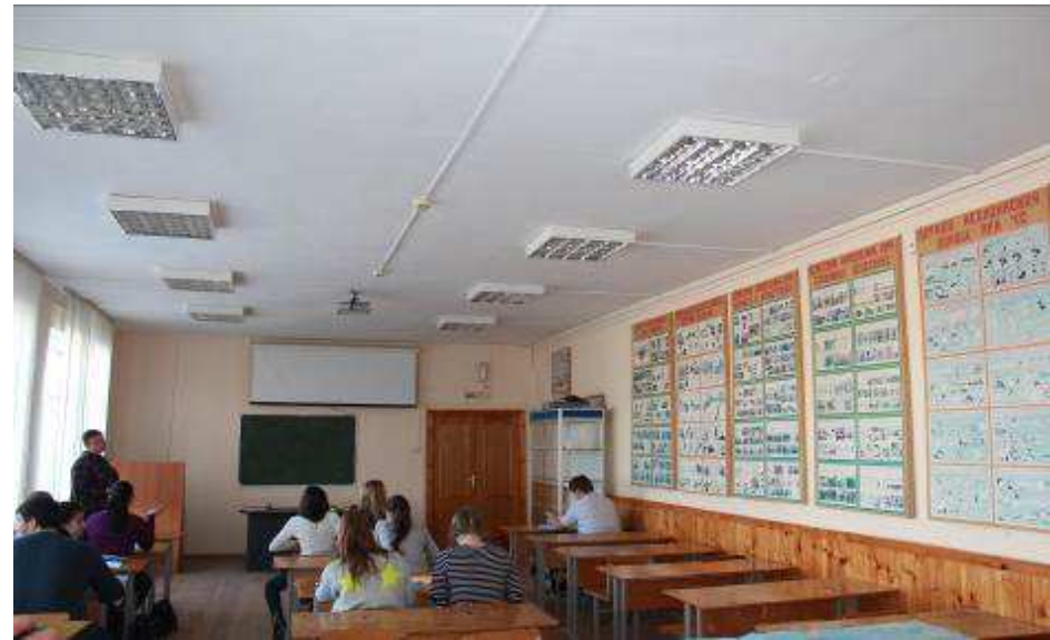
Кабинет безопасности жизнедеятельности