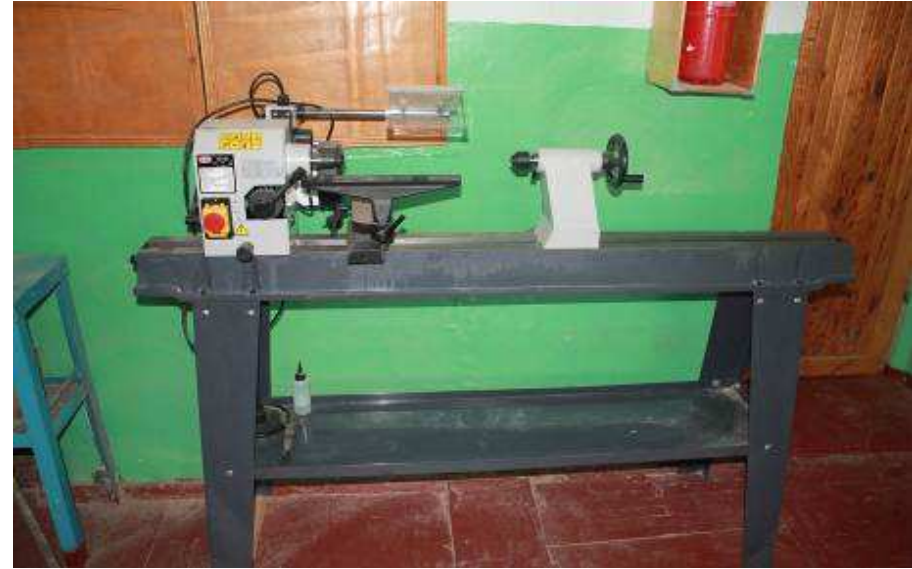
Лаборатория обработки металлов (токарный станок)