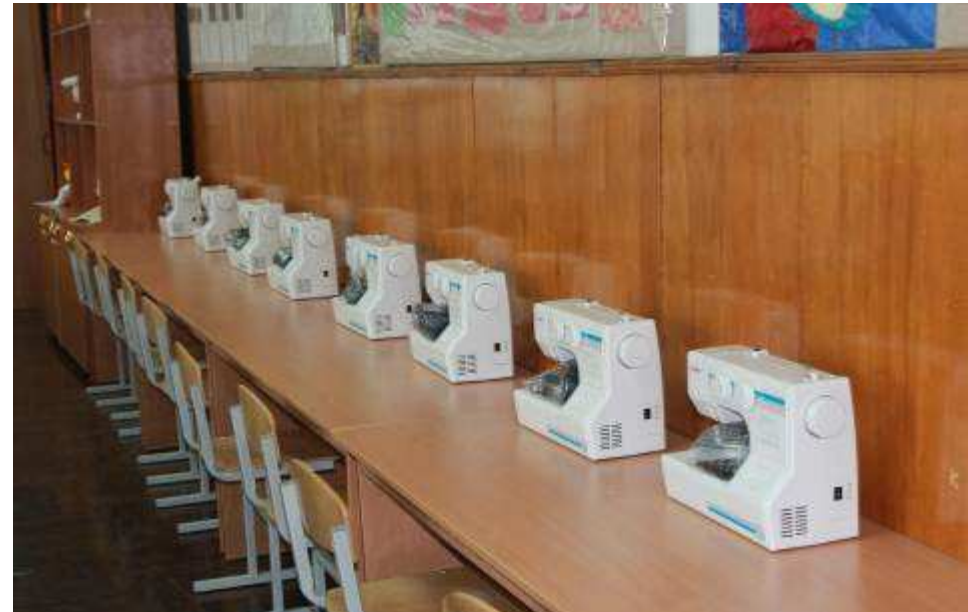
Лаборатория обработки тканей