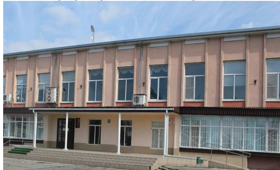
Здание учебного корпуса