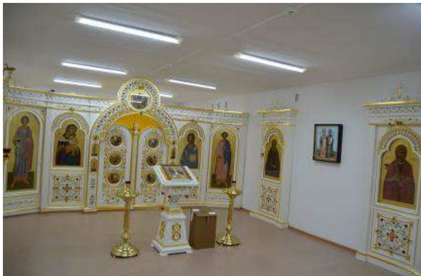
Храм Кирилла и Мефодия - находится в здании филиала