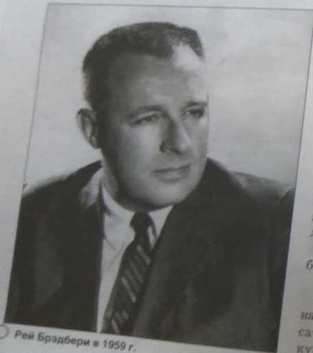
Рей Брэдбери в 1959 г.

БИБЛИОТЕКАРЬ: Да. В одном из интервью на вопрос: «В каком возрасте вы начали писать?» — писатель ответил: «В 12 лет. Я не мог купить продолжение «Марсианского война» Эдгара Берроуза». Именно тогда из-под его пера