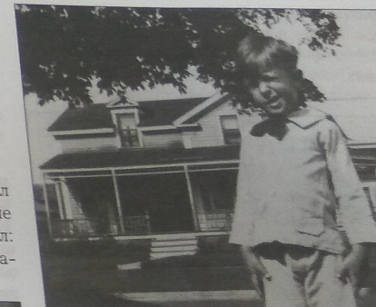
○ Рей Брэдбери в детстве

На экране портрет Рея Брэдбери в детстве.